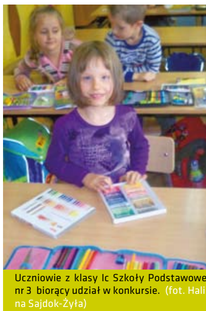
Uczniowie z klasy Ic Szkoły Podstawowej nr 3 biorący udział w konkursie.

Klasa VI d (wychowawca Henrietta Morawiec): I m. Agnieszka Legierska, II m. Martyna Pasternak, III m. Patrycja Legierska