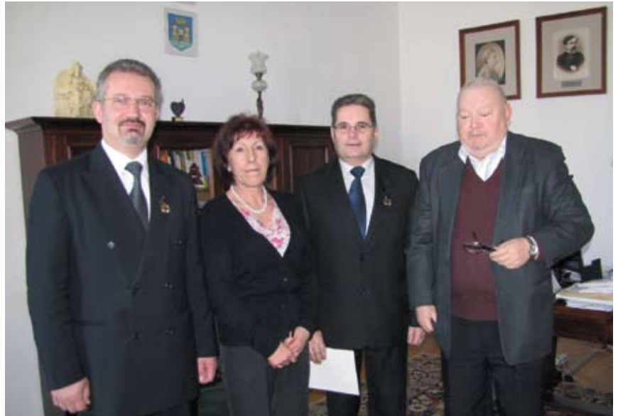
Pamiątkowa fotografia.