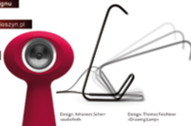
Design: Johannes Schier © 2012

wystawa: od 28 kwietnia do 10 czerwca 2012