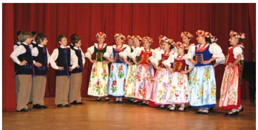
W XIX Regionalnym Przeglądzie Pieśni „Śląskie Śpiewanie” im. prof. Adolfa Dygacza udział wzięło 20 zespołów i solistów z województwa śląskiego.