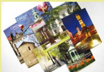
Zestaw kolorowych pocztówek ze zdjęciami Cieszyna otrzyma się za wypełnioną ankietę dotyczącą informacji o wydarzeniach kulturalnych.