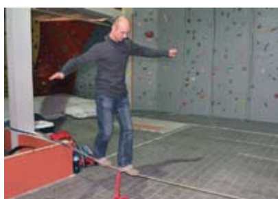
Chętni mogli spróbować swoich sił w slackline.

Okazją do rozmowy o cieniach i blaskach prowadzenia własnej firmy było spotkanie z cyklu Role Models, zorganizowane w ramach projektu „Przedsiębiorczość Akademicka na Start”. Wzięli w nim udział studenci - przyszli przedsiębiorcy, poszerzający wiedzę dzięki wspomnianemu projektowi, a także osoby, które pierwsze kroki w świecie biznesu mają już za sobą. Drugą grupą, która tego samego dnia odwiedziła „Strefę Wolności” byli członkowie Klubu Przedsiębiorcy. Klubowicze w tym roku spotykają się nie tylko w Zamku Cieszyn, ale odwiedzają także lokalne firmy. Tym razem była to „Strefa Wolności”. Historia tego miejsca zaczęła się od pasji właściciela do górskich wspinaczek. Minęło jednak kilka lat zanim pasja stała się też pomysłem na życie. „Rzeczywiście