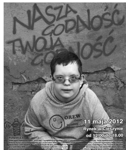
Dzień Godności Osoby z Niepełnosprawnością Intelektualną