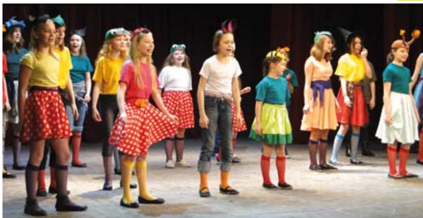
Walczących o zwycięstwo w Powiatowym Przeglądzie Dziecięcych i Młodzieżowych Zespołów Artystycznych nie brakowało.

Cieszyński Teatr im. A. Mickiewicza w dniach 16-17 kwietnia wypełnili uczestnicy Powiatowego Przeglądu Dziecięcych i Młodzieżowych Zespołów Artystycznych, którzy licznie przybyli z całego naszego regionu, aby zaprezentować swoje umiejętności sceniczne i rywalizować o nagrody finansowe.